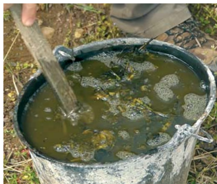
Brennnesseljauche ist für ihren strengen Geruch berüchtigt.

• Brühe: Eine Brühe wird genau wie die beschriebene Jauche angesetzt, Auf 10 l Wasser kommt 1 kg zerkleinertes Pflanzenmaterial. Dieses wird aber nur einen Tag lang eingeweicht