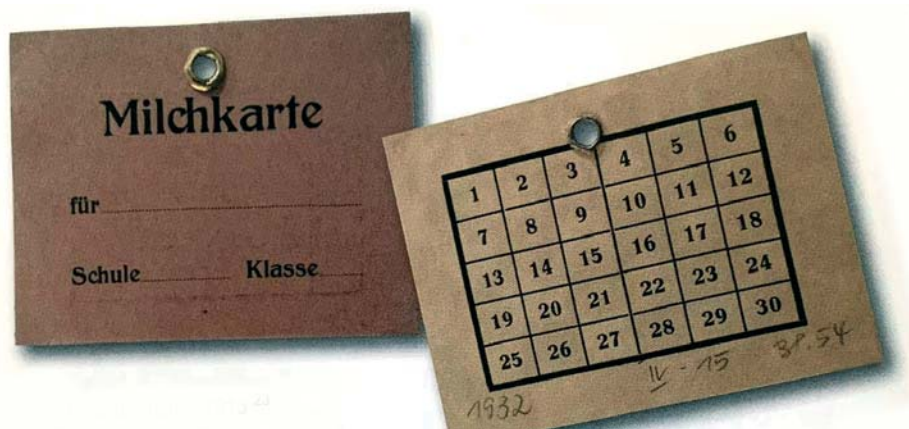
Milchkarte für Schulkinder aus dem Jahr 1932.