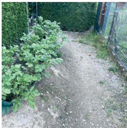
Konnte der Aushub mal nicht gleich abtransportiert werden, wurde er kleingärtnerisch zwischengenutzt.