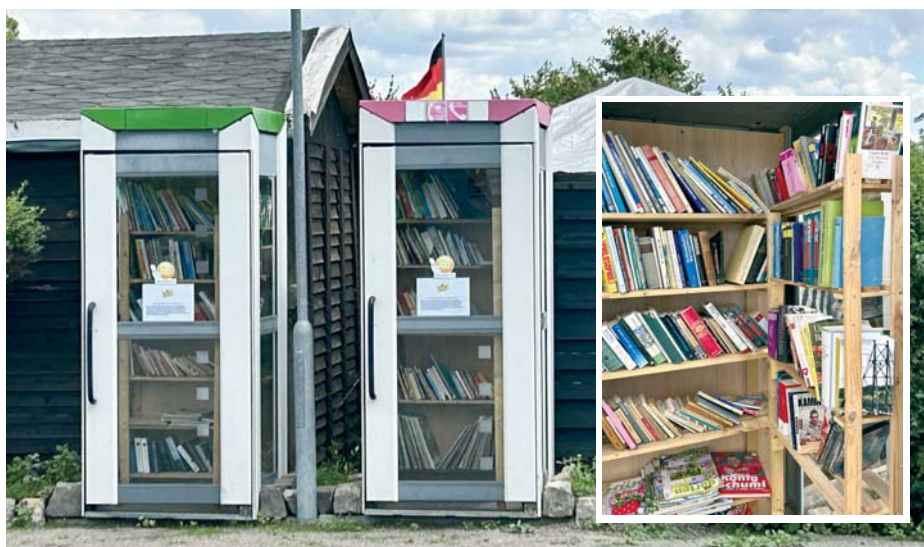
Außen Telefonzelle, innen vereinseigene Bibliothek – die Tauschboxen im Kleingärtnerverein „Kultur“ e.V.

Da es sich um Tauschboxen handelt, ist es erlaubt und ausdrücklich gewünscht, dass die Nutzer dieses Angebotes auch eigene, gut erhaltene Bücher mitbringen und diese in der Box für andere Interessenten hinterlassen.