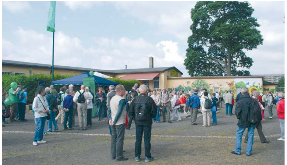
Der KGV war 2017 Start und Ziel der 13. Wanderung durch Leipziger Kleingartenanlagen.

Verein unter dem neuen Namen „Kleingartengruppe Lößnig-Dölitz“ in die damals gültige Struktur des Kleingartenwesens eingeordnet. Solidarität wurde großgeschrieben, die Gartenfreunde halfen einander und schafften wieder Ordnung.