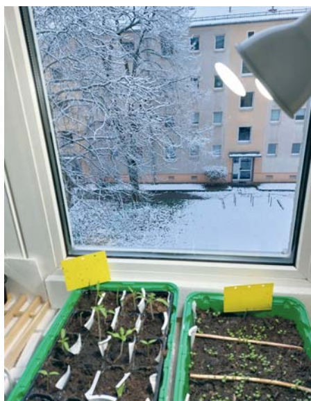
Im Februar oder März geht's los mit der Jungpflanzenanzucht.

im Garten allein aus. Dann müssen wir ggf. regulieren, was zu viel oder am unpassenden Ort ist.