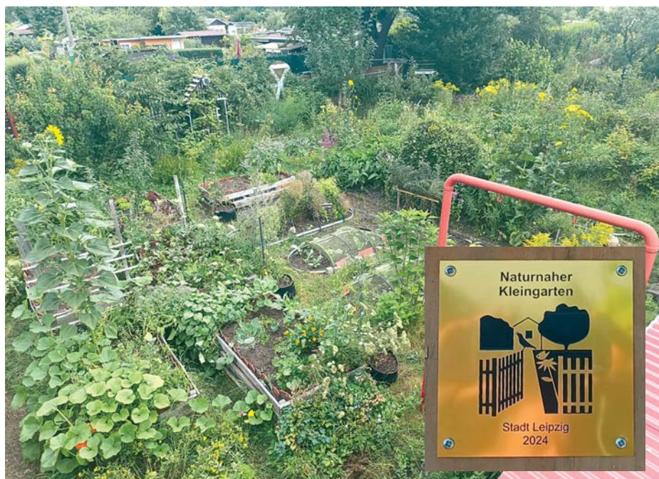
Der preisgekrönte naturnahe Garten und die Ehrenplakette.

Eine bunte Vielfalt aus einheimischen Obst- und Ziergehölzen, Blumen und Gemüse sowie Nützlingen bestimmen das Bild des Gartens. Zum naturnahen Garten gehört auch, der einheimischen Fauna die richtigen Lebensräume (Nischen) zu schaffen. Je vielfältiger der Garten gestaltet wird,