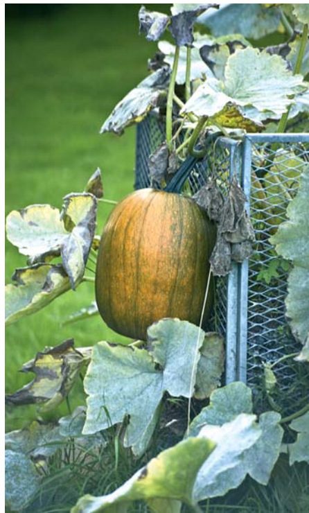
Ein Kompost gehört in jeden Kleingarten.