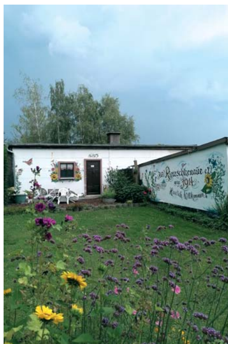
Das Vereinsheim des KGV „Rietzschkenau“ e.V.

„Rietzschkenau“ wieder als selbstständiger Verein neu gegründet wurde. Inzwischen hatte sich allerdings einiges geändert. Mit Wirkung vom 16. Februar 1946 wurden alle Gartenvereine in die damals gültige Struktur des Kleingartenwesens eingeordnet. Sie nannten sich Gartensparten und waren in Kleingartengruppen gegliedert. Ab 1959 war der VKSK (Verband der Kleingärtner, Siedler und Kleintierzüchter) die zuständige Dachorganisation für das Kleingartenwesen.