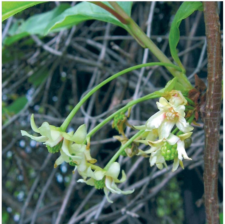
Bei der Chinabeere befinden sich weibliche (oben rechts) und männliche Blüten an ein und derselben Pflanze.

Im ersten Jahr der Pflanzung kann es vorkommen, dass sich nur weibliche oder nur männliche Blüten bilden und die Früchte ausbleiben. Doch im