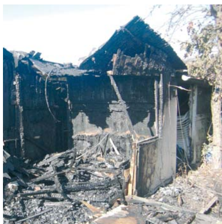
Die ordnungsgemäße Entsorgung solcher Brandrückstände sollte durch eine Fachfirma erfolgen.

Was kann der Verein tun? Zunächst sollte er im Rahmen der Öffentlichkeitsarbeit auf solche Probleme verweisen. Die Broschüre „Sicherheit in