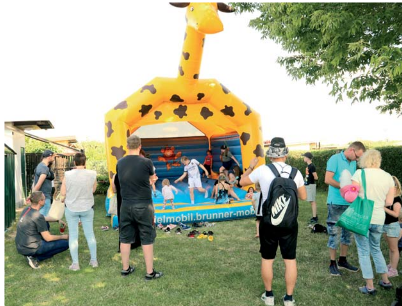
Die Hüpfburg war ein beliebter Kinderspaß.