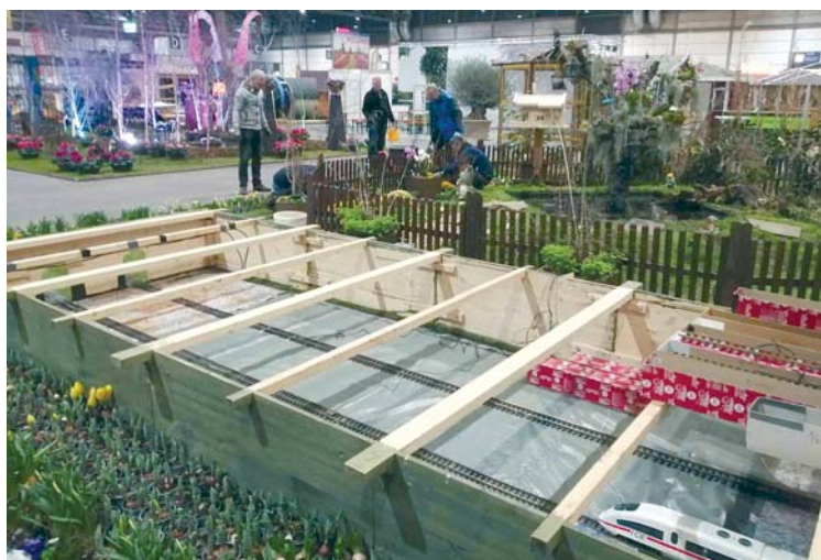
„Haus-Garten-Freizeit“ 2024: Die Präsentation im Zentrum von Halle 1 ist dank des Einsatzes des Aufbauteams fast komplett. Sind Sie 2025 mit am Start?

die Leipziger Messe wieder Material zur Verfügung gestellt. Unter fachlicher Anleitung bauten die begeisterten Kinder 380 Nistkästen.