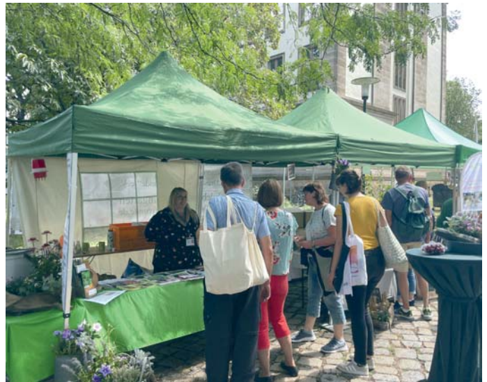
Die Angebote der Kleingärtner zum „Tag des offenen Regierungsviertels“ kamen bei den Besuchern gut an.