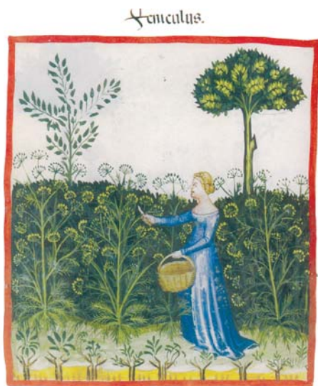
Eine Darstellung der Ernte des Fenchels in dem Tacuinum-Sanitas-Manuskript aus dem 14. Jahrhundert.

Zahlreiche Quellen belegen die weit zurückreichende Nutzung von Fenchel. Die Hethiter nutzten ihn vor über 4000 Jahren, um zerstörte Städte zu verfluchen. Hippokrates schrieb ebenso über die Pflanze wie Hildegard von Bingen.