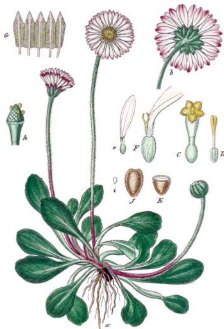
Das Gänseblümchen in „Deutschlands Flora in Abbildungen nach der Natur“ aus dem Jahr 1849. Abb.: Jacob Sturm / CCO

„hübsch“, während „ perennis “ ausdauernd heißt. Der deutsche Name Gänseblümchen könnte daher rühren, dass es auf Gänseweiden ideale Bedingungen vorfindet und gut ge-