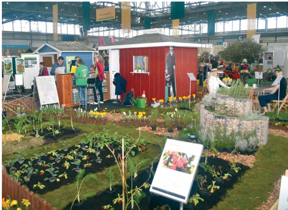
Gartengestaltung mit Fachberatung am Messestand der Leipziger Kleingärtnerverbände im vergangenen Jahr.

An ausgewählten Messtagen präsentieren sich u.a. der Sächsische Kartoffelverband (8./9. Februar), der Botanische Garten Oberholz (10. bis 12. Februar), der Landesverband Sachsen