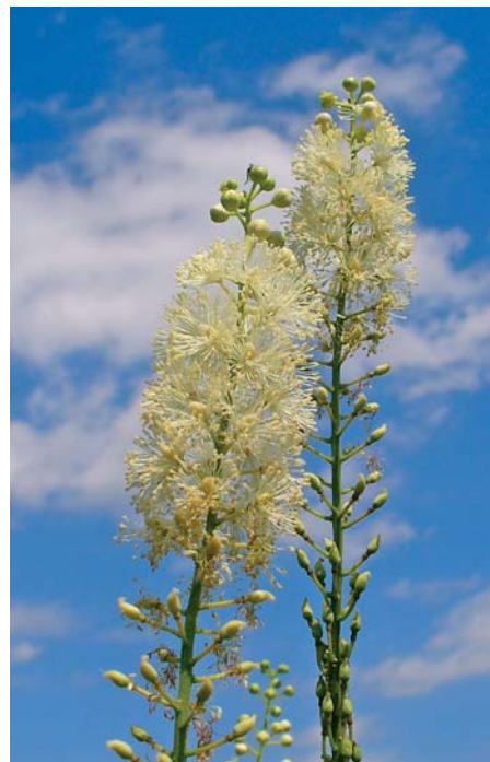
Die Silberkerze ist eine robuste Staude, die vom Juni bis in den Herbst mit ihren attraktiven Blüten Bienen und Schmetterlinge anlockt.

Silberkerzen benötigen einen durchlässigen, humus- und nährstoffreichen Boden, der ausreichend feucht