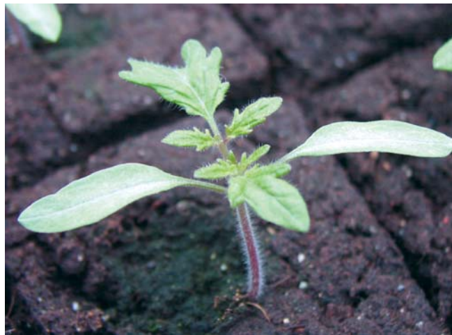
Ende Februar kann die Aussaat von Tomaten erfolgen. Beim Pikieren werden die Pflänzchen am besten in Pappblumentöpfe gepflanzt.

In meinen Fingern kribbelt's schon. Geht es Ihnen auch so? Mit der Aussaat von Paprika und Tomaten begin-