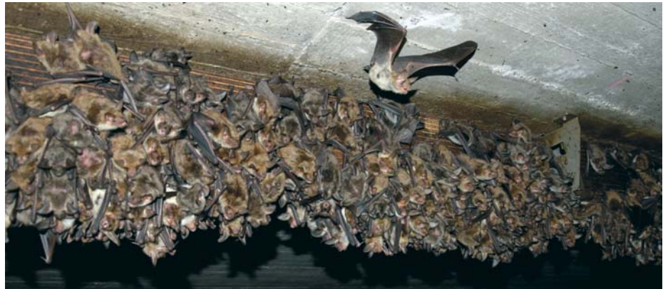
Ein Blick in die Wochenstube der Fledermaus.

Zwischen Ende Mai bis Ende Juni beginnt die Zeit der Fledermausgeburten. Der Geburtstermin hängt stark von klimatischen Bedingungen ab. Ist es noch zu kalt, rückt er nach hinten. In kalten Jahren sterben bis zu 50 Prozent der Jungtiere. Es gibt nur eine Generation pro Jahr mit einem Jung-