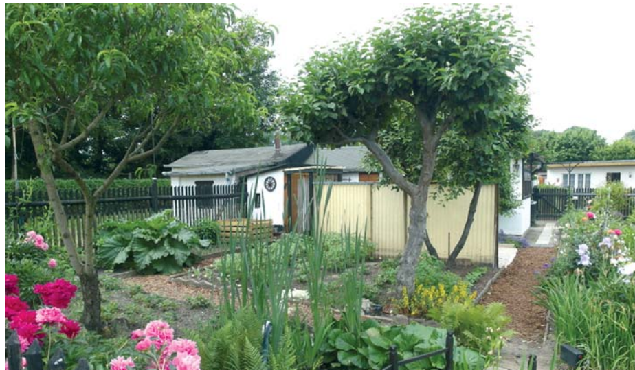
Bei durchschnittlicher Pflege können die Traufflächen der Obstbäume als kleingärtnerische Nutzflächen angerechnet werden.

Zur kleingärtnerischen Nutzung gehören z.B. Beetflächen und Hochbeete mit Gemüsepflanzen, Feldfrüchten, Erdbeeren, Sommerblumen und an-