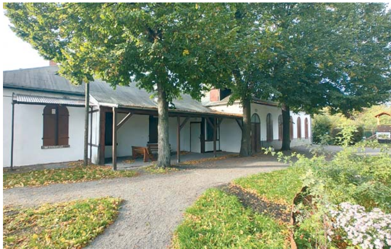
Das Vereinsheim des KGV „Immergrün“ e.V.

1925 wurde ein folgenschwerer Beschluss gefasst: Das Vereinsheim sollte erweitert und gründlich erneuert werden. Dazu wurde 1926 eine Hypothek von 35.000 RM zu 8 bis 8,5 % Zinsen aufgenommen. Das führte zur langanhaltenden Verschuldung des Vereins. Die Arbeiten am Vereinshaus