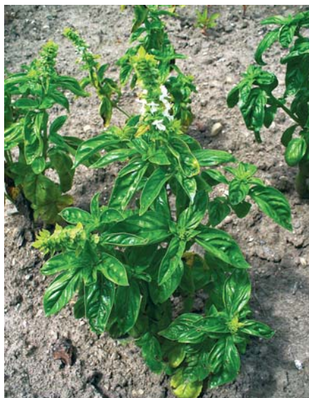
Basilikum ist im Garten leicht zu kultivieren.

Basilikum kann als Freiland- oder Topfpflanze kultiviert werden. Für das Freiland werden die Pflanzen vorkultiviert und ab Mitte Mai ausgepflanzt oder ins Freiland gesät. Der Reihenabstand sollte 20 bis 30 cm betragen. Basilikum ist ein Lichtkeimer, daher nur mit wenig Erde abdecken. Bei entsprechenden Temperaturen keimen die Pflanzen nach 10 bis 14 Tagen. Regelmäßiges Hacken und Gießen fördert eine gute Entwicklung.