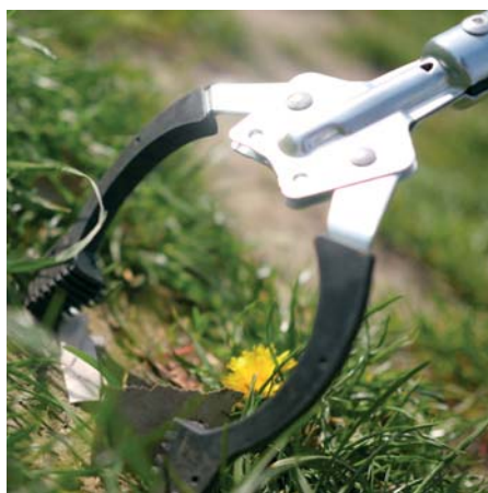
Die Stadtreinigung unterstützt den Frühjahrsputz mit Arbeitsmitteln und Abholung des Mülls.

Disteln sind bei vielen Kleingärtnern als nerviges Unkraut verhasst. Dabei kommt ihnen als Nahrungsquelle für viele Insektenarten große Bedeutung zu. Ihre Samenstände sind zudem ein Blickfang, wenn der Frost sie mit Reif verzaubert hat.