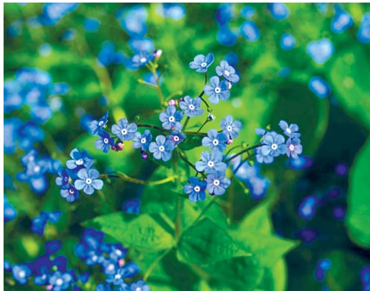
Das Kaukasus-Vergissmeinnicht ist eine attraktive und robuste Staude.

Brunnera macrophylla gibt es mittlerweile in jedem gut geführten Gar-