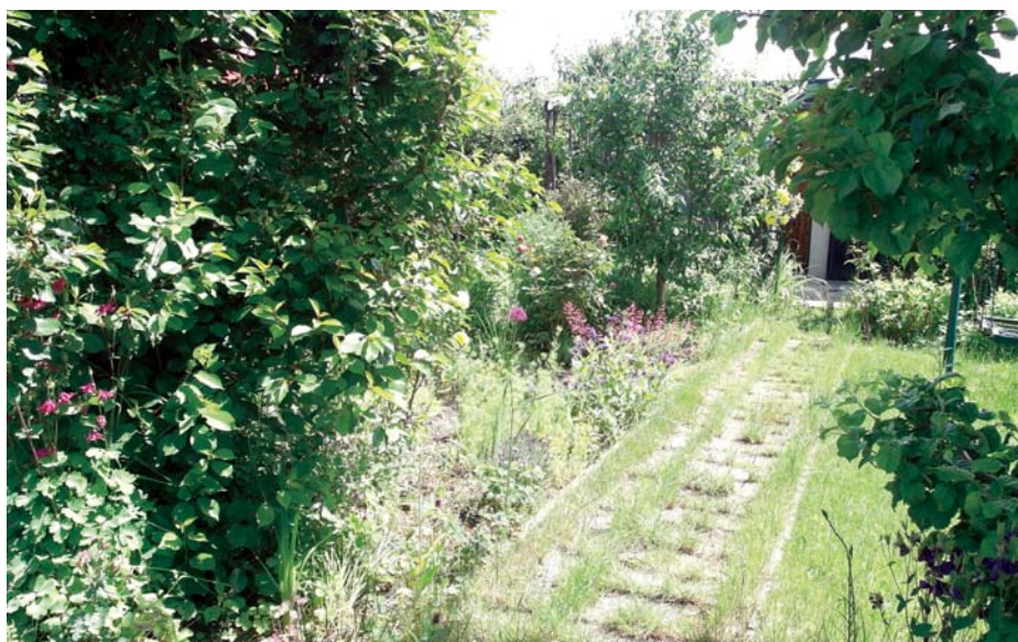
Die Grenze zwischen einem (im Bild zu sehenden) Pfliegerückstand und einem verwilderten Garten sind oft fließend.

Leider waren aus den 134 Vereinen des Kreisverbandes nur elf Fachberater der Einladung gefolgt. Nach der Vorstellung der Aufgaben der Fachberater kamen die Anwesenden schnell in die Diskussion über positive und weniger gute Erfahrungen in den Vereinen. Ein Schwerpunkt waren Parzellen, die von ihren Pächtern als natur-