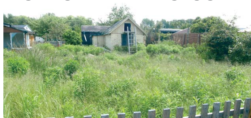
Ein Kleingarten verwildert nicht von heute auf morgen.

Allerdings ist nicht jeder Verstoß gegen die vorgeschriebenen Bewirtschaftungspflichten erheblich. Da nach