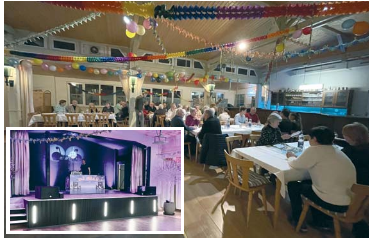
Bei der Veranstaltung für die fleißigen Helfer wurde auch die modernisierte Bühne (kleines Foto) in der Vereinsgaststätte genutzt.

So wurden z.B. noch Ende vergangenen Jahres sechs alte Öltanks aus dem Keller der Gartengaststätte entfernt und entsorgt sowie ein an die Fläche der Voliere grenzender Zwischenzaun zu einem Garten aufgestellt. Vielfältige Arbeiten zur Vorbereitung, Durchführung und Nachbereitung festlicher Höhepunkte im Vereinsleben (wie z.B. das Oster-, Garten-, Kinderfest und die Halloween-Party) sicherten deren erfolgreiche Durchführung.