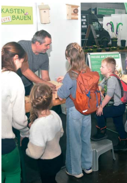
Der Nistkastenbau kam gut an.

Zum Vormerken: Die nächste „Haus-Garten-Freizeit“ findet vom 31. Januar bis 8. Februar 2026 statt. -r