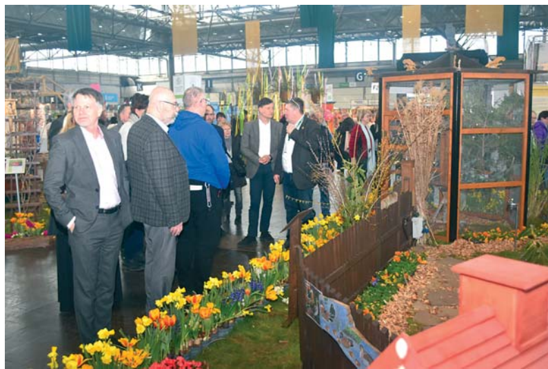
Mitglieder des Kleingartenbeirates am Stand der Leipziger Kleingärtner.

In der Gartenlandschaft waren u.a. Möglichkeiten für die Parzellengestaltung und die Dachbegrünung dargestellt. Dort waren auch die Fachberatung sowie die Vogelschutzlehrstätte des Stadtverbandes präsent. Wesentliche Anziehungspunkte waren allerdings das Modell einer Kleingartenanlage, die Züge der Modellei-