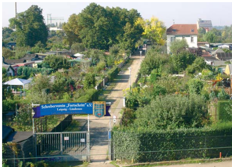
Die Anlage des Schrebervereins „Fortschritt“ e.V. ist Start und Ziel der Wanderung.