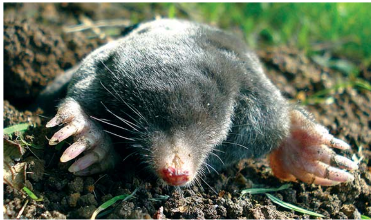
Der Maulwurf ist einer der größten und zugleich bei Kleingärtnern (neben der Wühlmaus) unbeliebteste tierische Bodenbewohner.

Die Bodenbearbeitung ist nötig, um das Aufkeimen der Saat oder das Anwurzeln der eingesetzten Pflanzen zu erleichtern. Bedeckt man den Boden