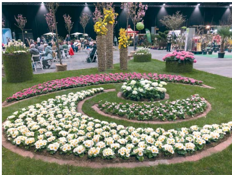
Zum Internationalen Frauentag stand 2024 ein Besuch der Messe „Chemnitzer Frühling“ auf dem Programm.

en großes Potential für das Ehrenamt besitzen. Aufgrund ihrer Lebenserfahrung, ihres Organisationstalentes und ihrer sozialen Kompetenz sind sie bestens für eine Wahlfunktion geeignet. Sie bringen ihre Meinung mitunter deutlich zum Ausdruck, arbeiten zielstrebig und verantwortungsbewusst. Auch in den Geschäftsstellen beider Verbände würde es ohne Frauen nicht so gut laufen. Im Sekretariat sind sie