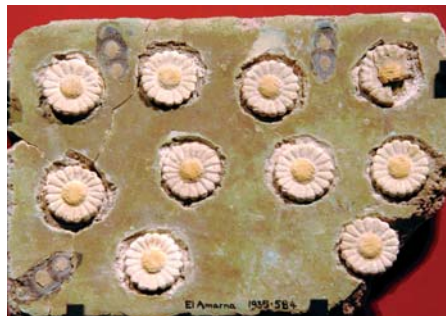
Eine altägyptische Fayence-Wandfliese mit eingelegten Gänseblümchenblüten aus der Zeit um 1.400 v. Chr.

Das Gänseblümchen ist eine interessante Nahrungspflanze und wichtige Zutat für Wildsalate und Frühjahrsuppen. Die jungen Blätter, Knospen und Blüten bereichern Gemüse- und Spinatgerichte und können unter Kräuterquark und -käse gemischt werden. Außerdem können die Blüten für Tee und die gesamte Pflanze zur Gewinnung von Frischsaft genutzt werden. Junge, noch nicht so stark behaarte Blütenknospen sind eine delikate Beigabe in Wildsalaten. Ältere Knospen