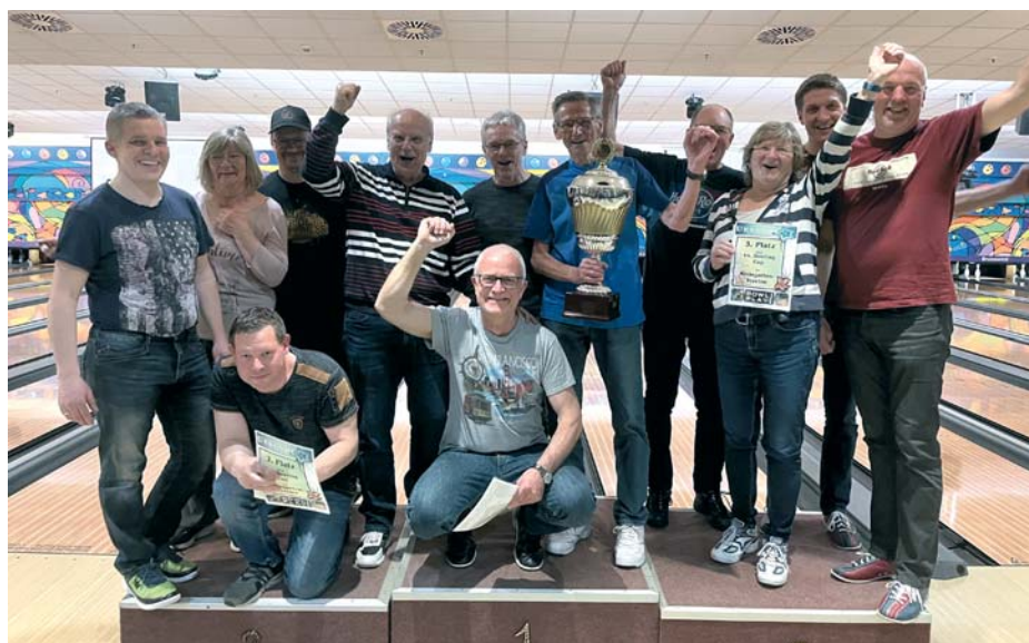
Das waren die Siegerteams: Am Finkenweg (Mitte), Pinschubser Freiland (links) und Seilbahn 1 (rechts).

Ein Wechsel hat auch am Tabellenende stattgefunden: Der Trostpreis für die wenigsten Pins ging in diesem Jahr an das Team „Sonnenblume 1“