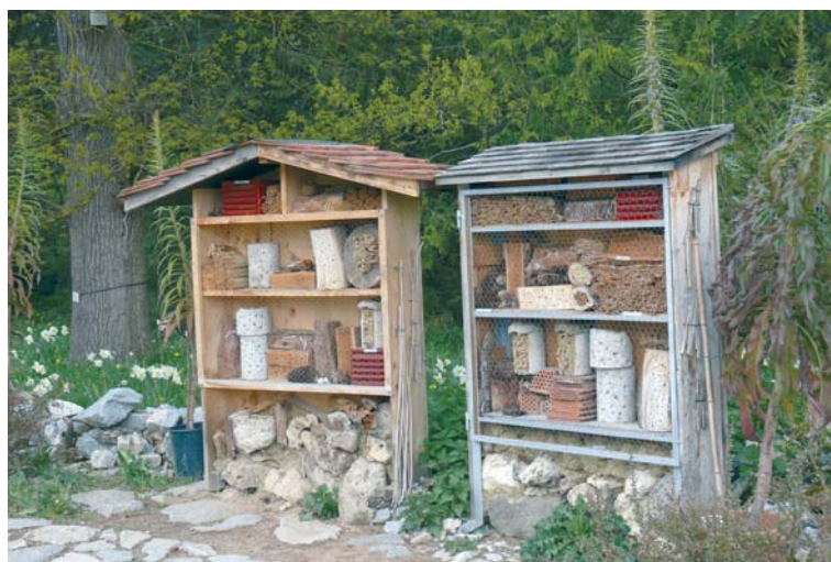
Insektenhotels (hier zwei Exemplare im Botanischen Garten München) lassen sich mit einfachen Mitteln bauen.

Insektenhotels sind Nist- und Überwinterungshilfen für die Nützlinge im Garten. Eltern oder Großeltern können so ein Hotel mit Kindern oder Enkeln selbst bauen. Das ist leicht, mein Mann hat mit den Enkelkindern eines gebaut, dazu wurden vier Hül- sen, vier Pfosten, Bretter, Baumstüm-